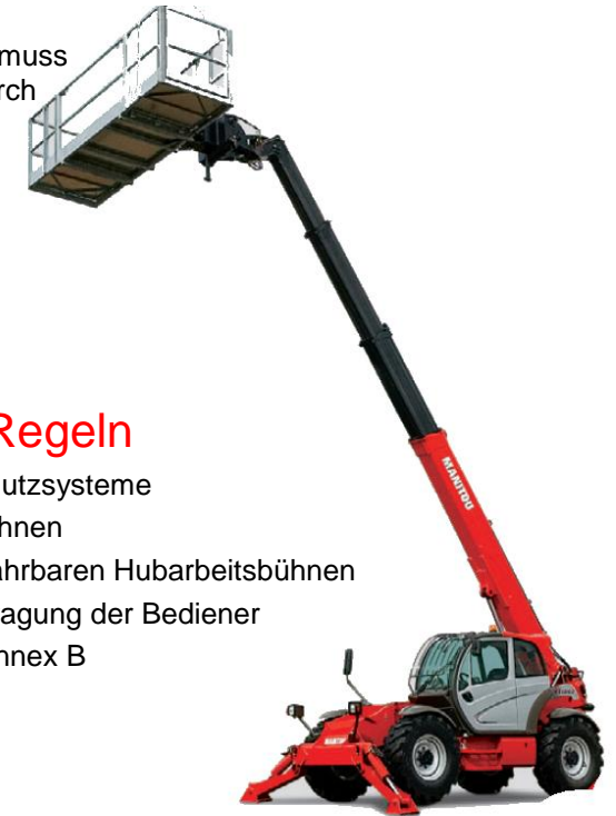
4 Multifunktionsgerät mit schwenkbarem Arbeitskorb und geeigneten Zustiegstüren.

Ein Fangstoss auf den Arbeitskorb muss ausgeschlossen werden, weil dadurch das Gerät unter Umständen zum Umsturz gebracht werden kann.