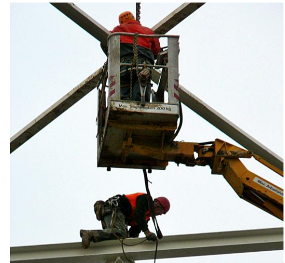
2: Alternative zu Bild 1: Zugang mittels Hubarbeitsbühne