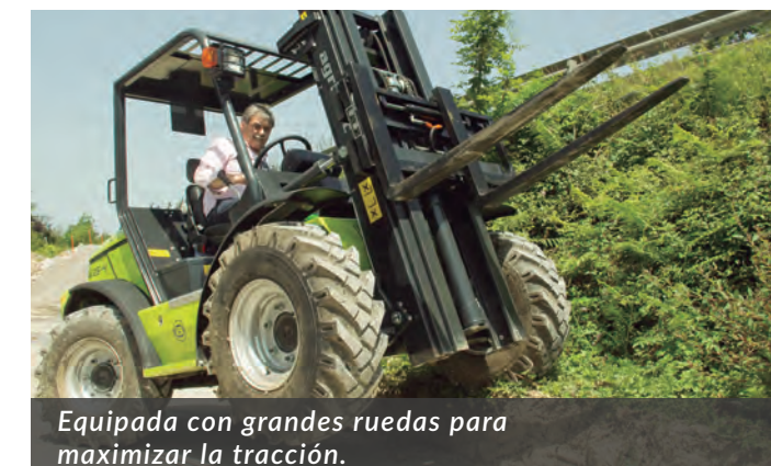
Equipada con grandes ruedas para maximizar la tracción.