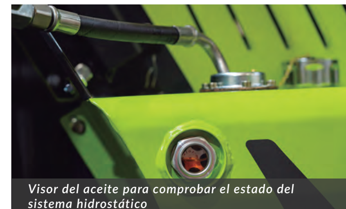
Visor del aceite para comprobar el estado del sistema hidrostático

La TW25 es un modelo formidable, cuidado hasta el menor detalle; pensado para un uso intensivo en las peores condiciones, configurado para un gasto mínimo en combustible y un gasto cero en mantenimiento.