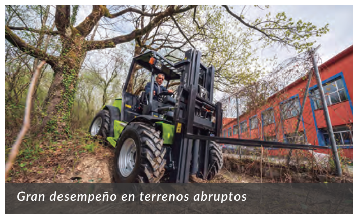
Gran desempeño en terrenos abruptos

Con todo, esta carretilla tiene varios aspectos técnicos en los que merece la pena detenerse. El primero de ellos es el motor mecánico Perkins de 50 CV Fase III A. Los ingenieros de Agrimac han priorizado el uso de un motor mecánico sobre uno electrónico para garantizar el mínimo coste de mantenimiento de la máquina. Los motores electrónicos son más caros de mantener y además requieren el uso de filtros de partículas