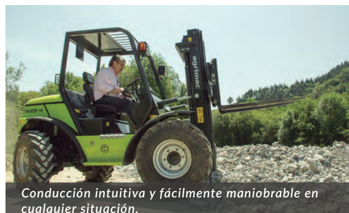
Conducción intuitiva y fácilmente maniobrable en cualquier situación.